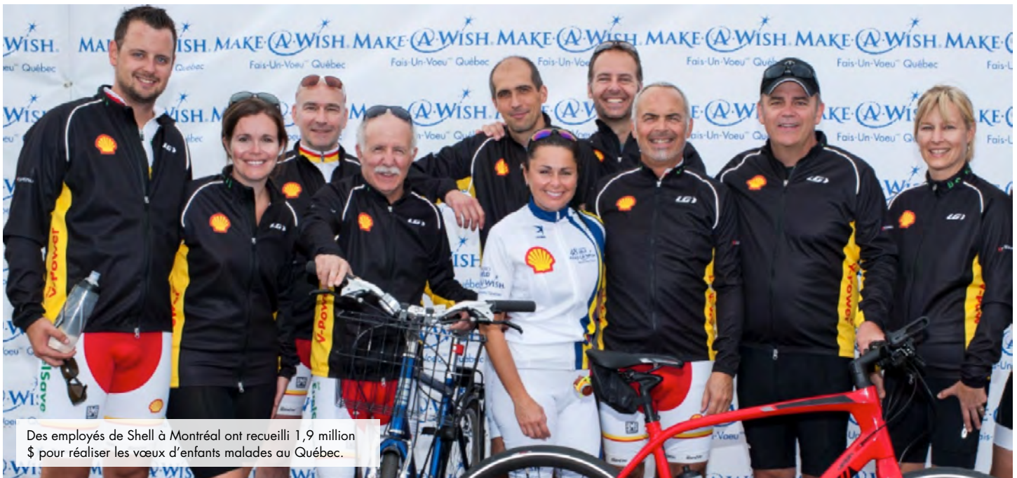
Des employés de Shell à Montréal ont recueilli 1,9 million $ pour réaliser les vœux d'enfants malades au Québec.

Ils ont déjà hâte de recommencer l'année prochaine. Félicitations à tous. ■