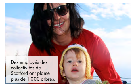
Des employés des collectivités de Scotford ont planté plus de 1,000 arbres.

Un grand merci à tous les bénévoles sans qui ces plantations d'arbres n'auraient pas connu le même succès. ■