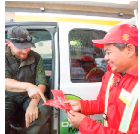
Shell surprend ses clients

Pour étendre la portée de l'initiative #chooseourbest, nous avons utilisé la radio, des publicités extérieures et les médias sociaux afin de permettre aux personnes de gagner le voyage de leurs rêves grâce à un concours d'égoportrait à shell.ca.